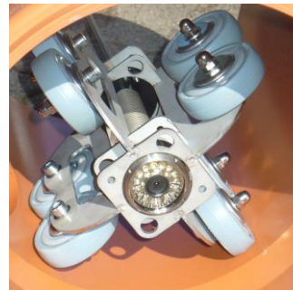
Rollenschiebewagen bis DN 500