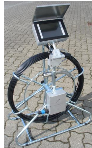
Kamerahaspel 50m mit TFT (IP 65) und automatisch aufrechtem Bild

Typisch: Wir produzieren ein durchdachtes System mit kompatiblen Schnittstellen und austauschbarem Zubehör - und dies seit vielen Jahren.